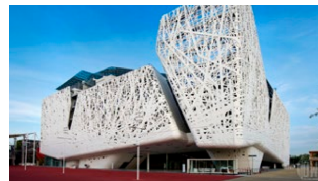
Национальный павильон «Палаццо Италия» в Милане

В Европе фотокаталитический бетон применяют не только для производства тротуарной плитки, но и при возведении зданий и сооружений. Яркие примеры — церковь «Щедрость