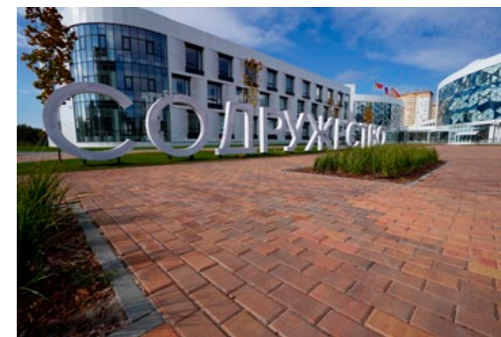
Мегашкола в Воронеже

милосердия» в Риме, построенная архитектором Ричардом Майером, и национальный павильон «Палаццо Италия» в Милане.